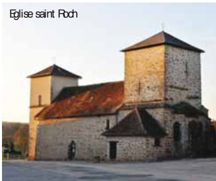
Eglise saint Roch

Reprendre le descriptif du sentier "Le Père Castor" (voir au dos) aux points 4, 5 et 6. Rejoindre ainsi le point de départ au lac de la Roche.