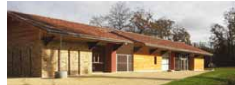
la médiathèque du Père Castor